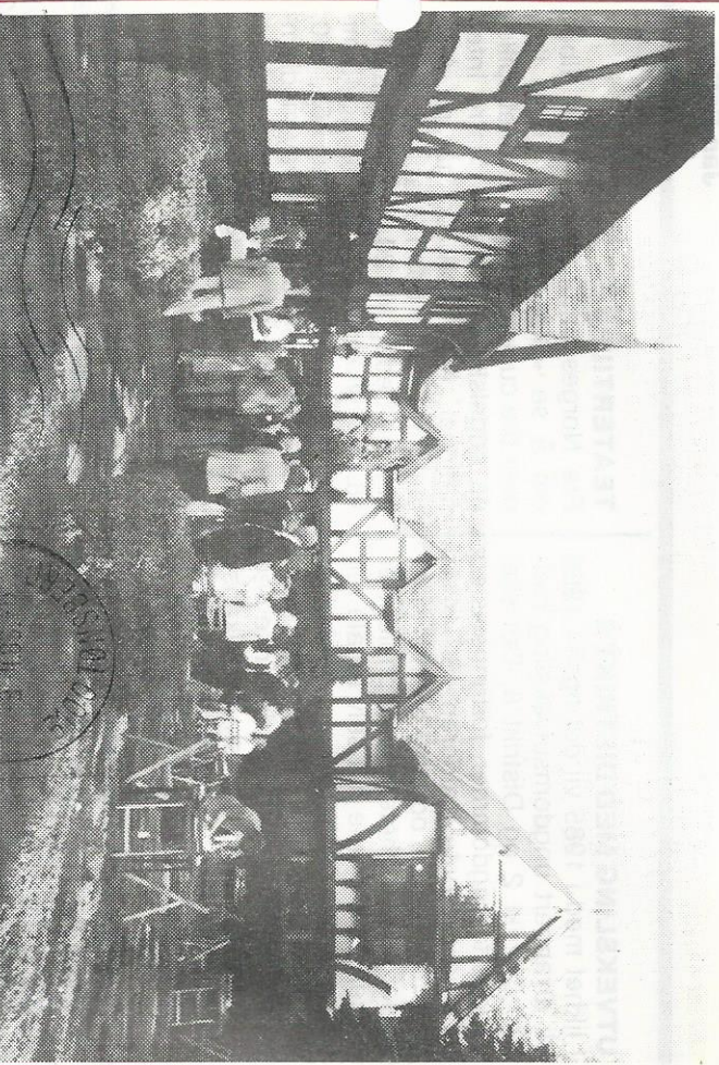
Fredriksten Lodges eiendom.

GRAND HOTEL 2. ONSDAG I HVER MÅNED: KL. 19.00: FORRETNINGSMØTE. KL. 20.00: SOSIALT SAMVER