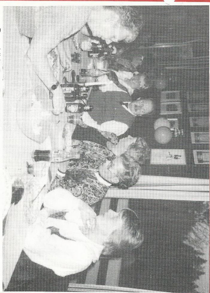
Bare blide fjøs og koselige samtaler under premieutdelingsfesten.