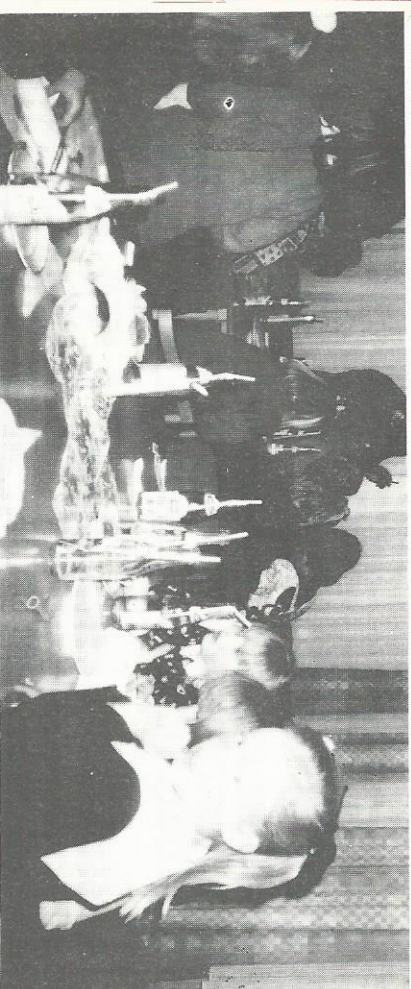
En forsamling av de yngre dypt konsentrert om sin konkurranse.

APRIL-MØTET: Siden vårt april-møtet fant sted midt i påskeuken, valgte til vi å legge det opp med en familievennlig profil. Dette resulterte i at mange tok med seg sine barn og barnebarn, totalt 18 barn i alderen 5 mnd. til 16 år. Det var lagt opp til et enkelt forretningsmøte, før det var konkurranser for både store og små. De voksne skulle finne hovedsteder i amerikanske stater, de mellomste skulle finne norske byer og de minste dro på skattejakt etter påskeegg. Vi hadde også en stafett mellom 2 voksne lag hvor det gjaldt å blåse opp poser og få dem til å smelle. Ellers gikk praten livlig mens man koste seg med kaffe og kaker. Vel møtt igjen ved en senere anledning alle sammen, jø store og små.