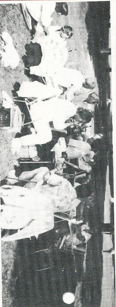
En del av Osebergs medlemmer samlet i Frognerparken i forbindelse med feiringen av 4. juli.