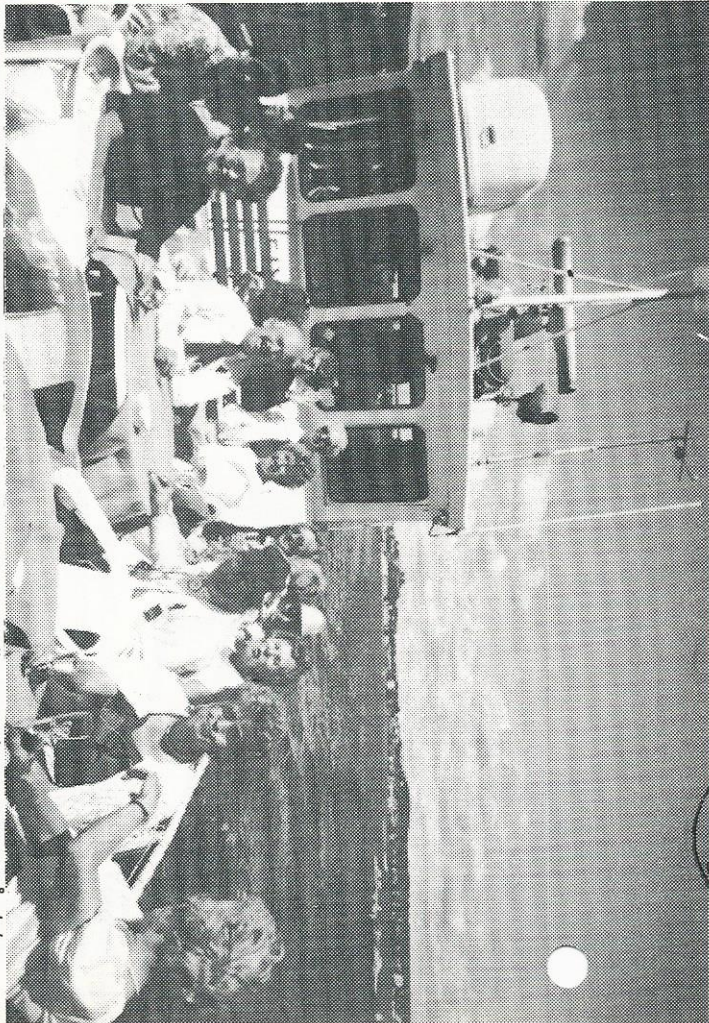
Medlemmer av Baldry Squaredancere og Osebergs medlemmer hygger seg på dekket av Eivindvik etter paraden.