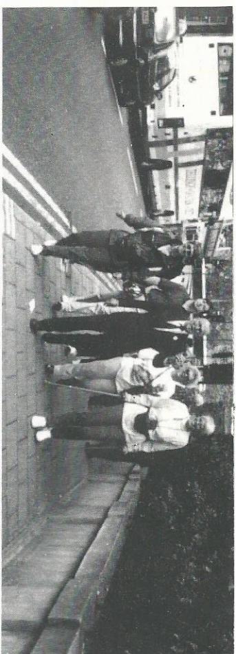
Her er noen av våre «Flittige Liser» på tur med egen guide i London