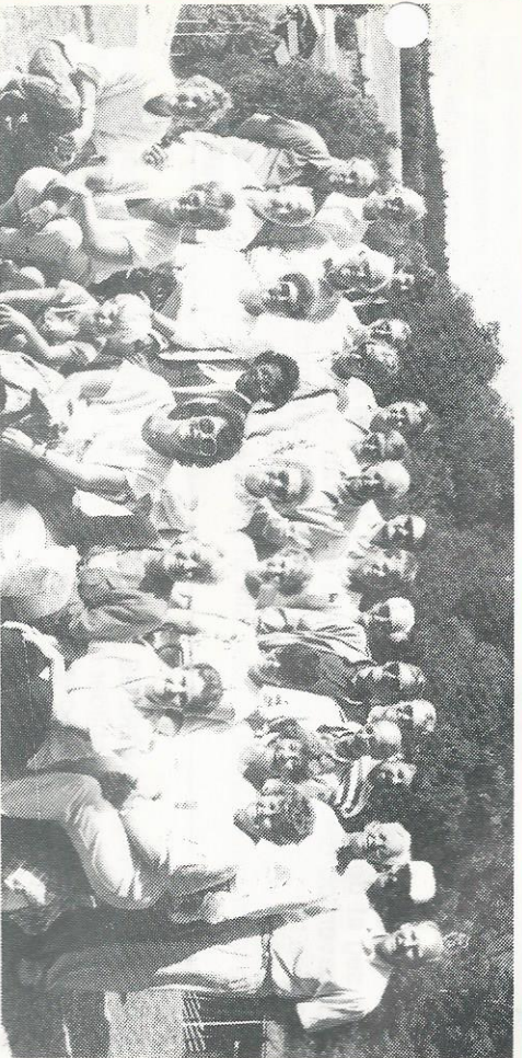
Vi har her samlet deltagerne på tunet på Stiklestad under omvisningen som foregikk lørdag formiddag.