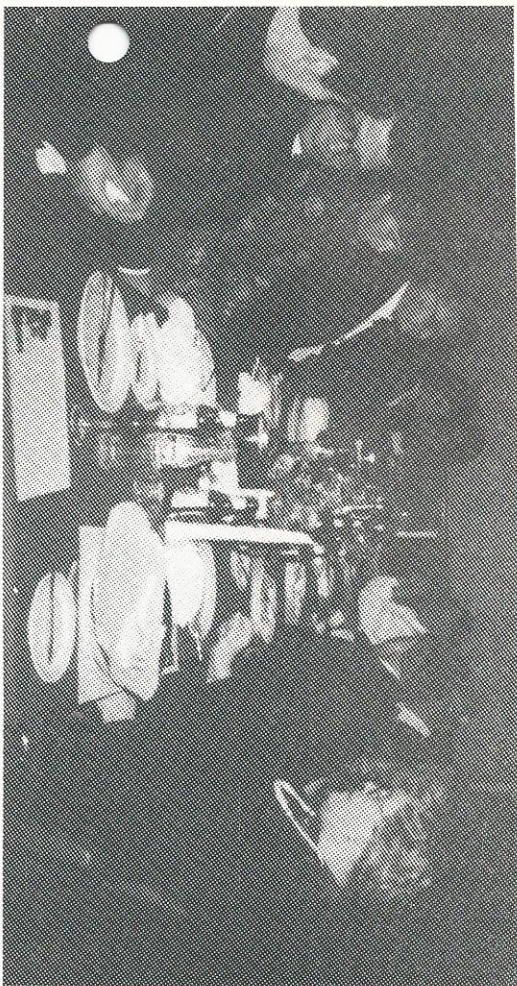
Fra vår høstfest i Samfunnshuset i november.